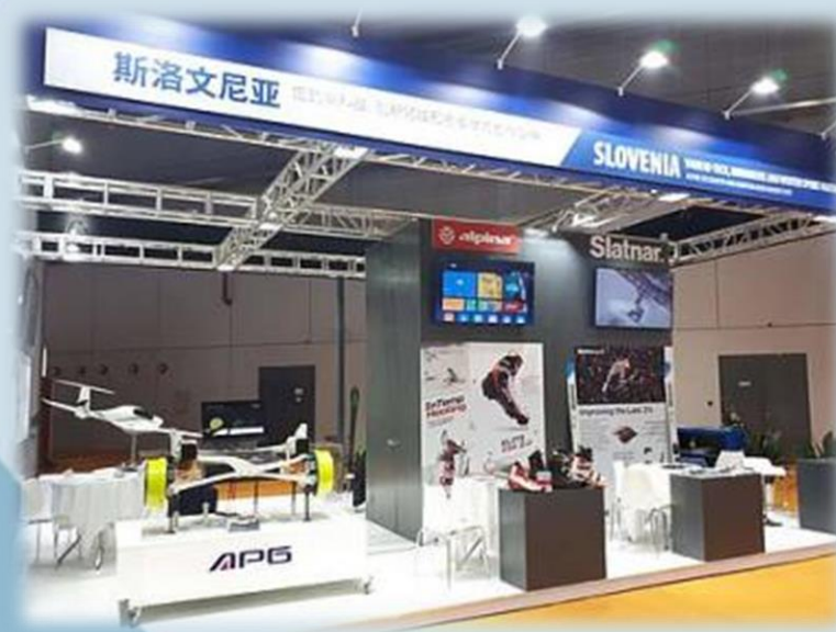
Slovenska stojnica na China International Import Expo na Kitajskem.

Poročanje ganskih medijev o slovenskem obisku.